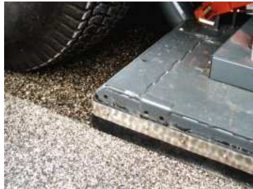
Aszfalt tapadás javítás