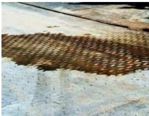
Olajjal szennyezett térkő