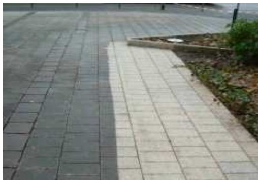
A szennyezett és a megtisztított felület

Speciális gépek segítségével komplett sétáló utcákat, játszótereket, sportlétesítményeket könnyedén és gyorsan tisztíthatunk meg úgy, hogy a burkolatokból a szennyeződések tökéletesen eltávolíthatók, s így az eredetihez közeli állapotot visszaállítjuk. Nagy teljesítményű takarítógépekkel rágógumik, olajfoltok eltávolítását végezzük, illetve elkoszolódott térkövek takarítását vállaljuk.