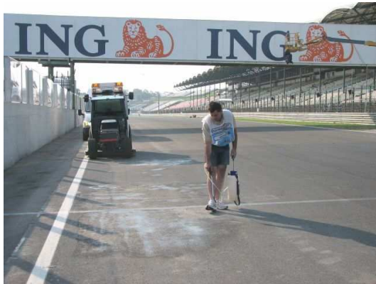
Hungaroring F 1 futam előkészületek

Autópályákon, versenypályákon, utakon, közterületeken az olajfolyásokból eredő károkat is maradéktalanul el tudjuk hárítani. A tisztítás során a felület pórusaiba beszívódott olajszenyeződés is teljesen eltűnik.