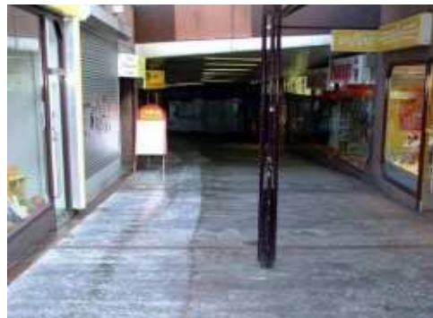
Tisztítás gránit burkolaton