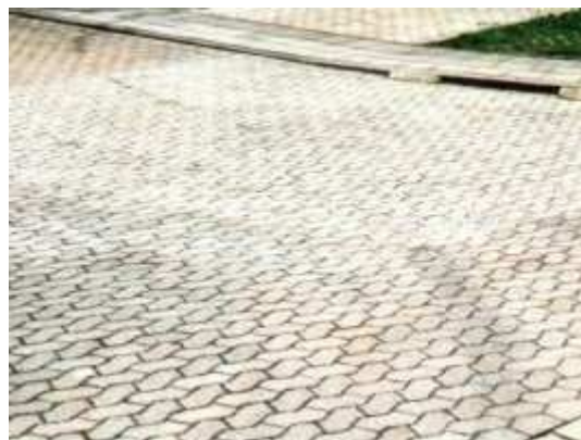
A megtisztított felület